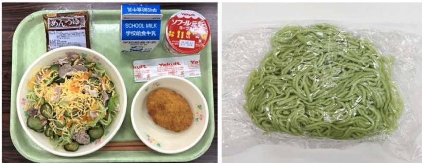
左：ユーグレナクロレラ麺のメニュー「南ぬ豚サラダめん」イメージ、右：ユーグレナクロレラ麺イメージ